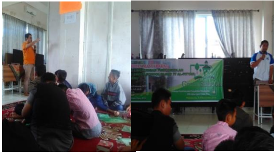
Gambar 2. Suasana penyuluhan dan diskusi