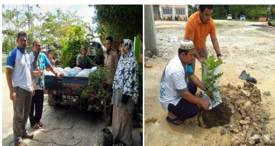
Gambar 3. Kegiatan penanaman

16:16:16. Pupuk anorganik diberikan dengan dosis 2 sendok makan (tanaman masih kecil) dan diberikan dengan cara ditabur di sekeliling akar namun tidak boleh mengenai batang tanaman karena dapat menyebabkan tanaman menjadi mati. Untuk penanaman dilakukan dengan cara yang sama yaitu hanya menggunakan tanah campuran tanah top soil dengan pupuk kandang.