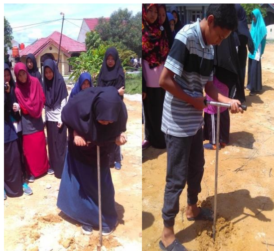
Gambar 4. Pembuatan lubang biopori

Kegiatan praktik lainnya adalah mengajarkan kepada siswa untuk membuat lubang biopori. Pembuatan lubang biopori (Gambar 4) penting dilakukan untuk meningkatkan pori-pori tanah yang berfungsi menjaga ketersediaan air dalam tanah pada saat musim kemarau dan menyimpan air tanah pada saat musim hujan. Selain itu juga sebagai sarana menjaga kesuburan tanah karena memberikan bahan organik kedalam tanah. Dengan melakukan praktik secara langsung siswa menjadi tahu bagaimana cara membuat lubang biopori tanah dan dapat menerapkan baik di sekolah maupun di lingkungan rumah.